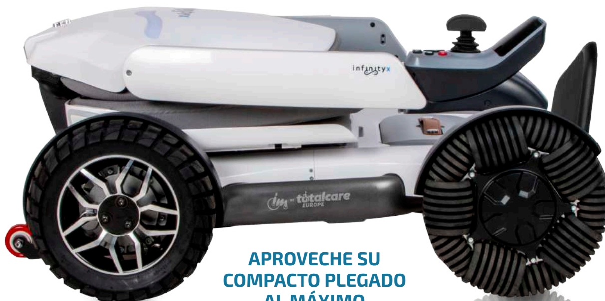
APROVECHE SU COMPACTO PLEGADO AL MÁXIMO