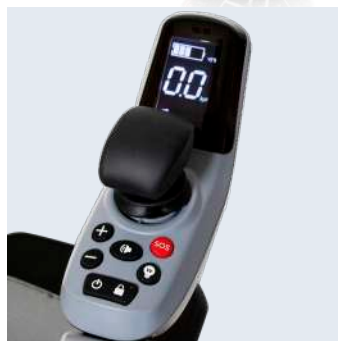
PLEGADO ELECTRÓNICO POR EL JOYSTICK