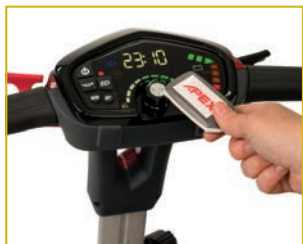
Pantalla multifunción y llave de proximidad