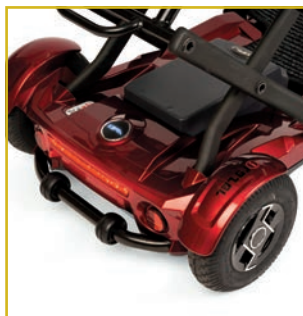
Ruedas neumáticas y antivuelco