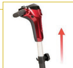
Manillar ergonómico y regulable en altura