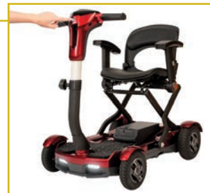
Botón de plegado de fácil acceso.