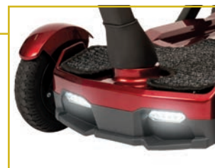
Luces LED delanteras y traseras.