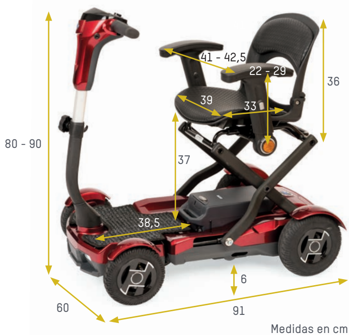
Medidas en cm