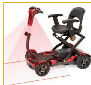
El laser indica el espacio de seguridad necesario para circular.