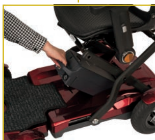
Batería de litio extraíble (14,5 Ah) para facilitar su carga.