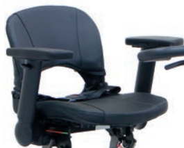
Cinturón de seguridad